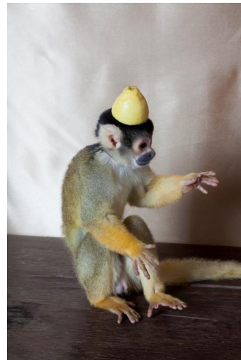
Istvan Balogh Monkey with Lemon , 2009 Impression Lambda, 1-4 60 x 40 cm