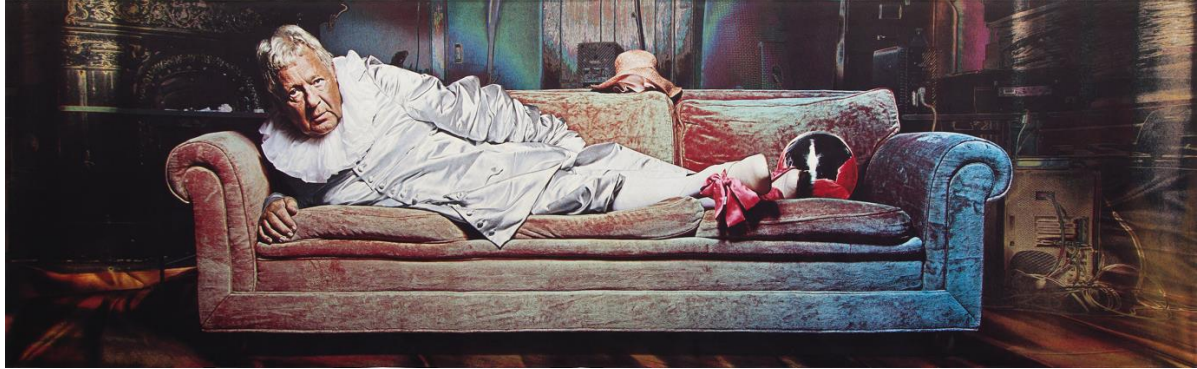
Miriam Bäckström , The Opposite of Me Is I , 2011, Jacquard-Wandteppich (Seide, Wolle, Baumwolle, Acryl und Lurex auf Trevira CS), 290 x 970 cm, Courtesy die Künstlerin