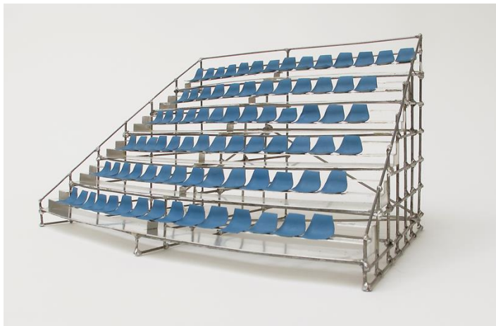
Boris Rebetez Regarde et je regarde aussi , 2001 Mixed media 37 x 29 x 27 cm

Kunstmuseum Thun Thunerhof, Hofstettenstrasse 14, 3602 Thun T +41 (0)33 225 84 20 / F +41 (0)33 225 89 06 kunstmuseum@thun.ch, www.kunstmuseumthun.ch