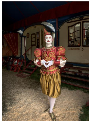
Michael Dannenmann Fulgenci Mesters Bertran – Weissclown Gensi , 2016 C-Print, 39.5 x 29.3 cm