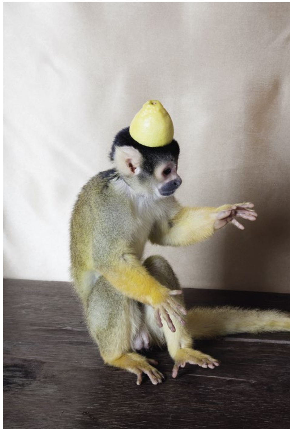
Istvan Balogh, Monkey with Lemon , 2009, Lambda-Print, 1-4, 60 x 40 cm.