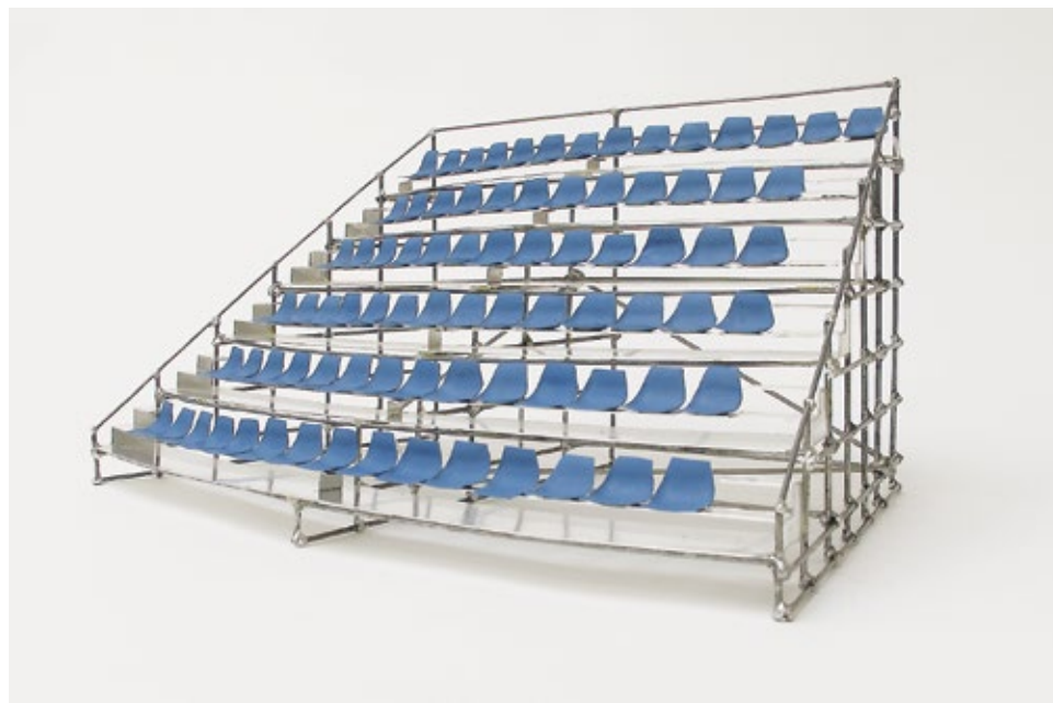
Boris Rebetez, Regarde et je regarde aussi , 2001, Mixed media, 37 x 29 x 27 cm.

Zur Ausstellung erscheint ein gleichnamiger Katalog / the exhibition will be accompanied by a catalogue im / published by Hirmer Verlag ISBN: 978-3-7774-4179-5