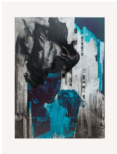
Lorna Simpson (b. 1960) Black & Ice, 2017 Ink and screenprint on gessoed fiberglass panel Unique 170.2 x 127 x 3.5 cm / 67 x 50 x 1 3/8 inches