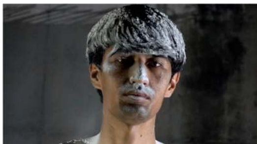
Baqer Ahmadi, The Discipline of Punishment / The Diaspora of My Soul , 2021/22, Filmskizze.