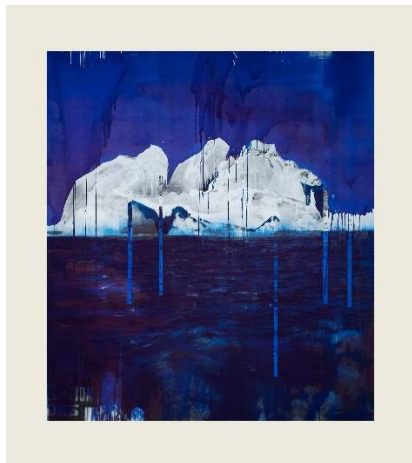
Lorna Simpson, Blue True Illustration , 2019 Ink and screenprint on gessoed fiberglass 274.3 x 243.8 x 3.2 cm